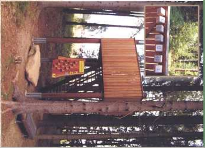
Hochstand und einheimische Wildtiere