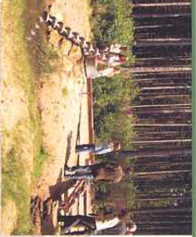
„Schraube des Archimedes“