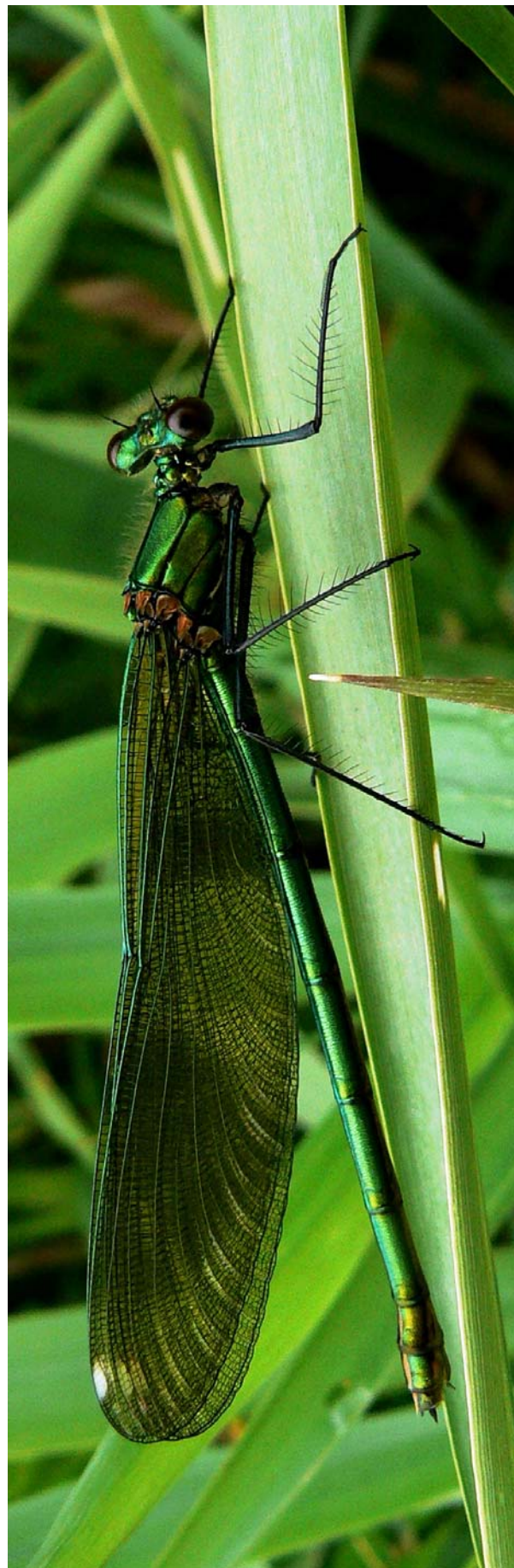
Bei genauerem Hinsehen entdeckt man die Kunstwerke der Natur: Blauflügelige Prachtlibelle

Bei einem Rundgang durch die Natur lernen wir essbare Blüten und zahlreiche Rezepte kennen. Natürlich mit Kostproben. Kosten: 8 €; Leitung: Heike Ehl; Anmeldung nötig: Tel. 09208/57691; Ort: Sandhof, Dressendorf (Goldkronach)