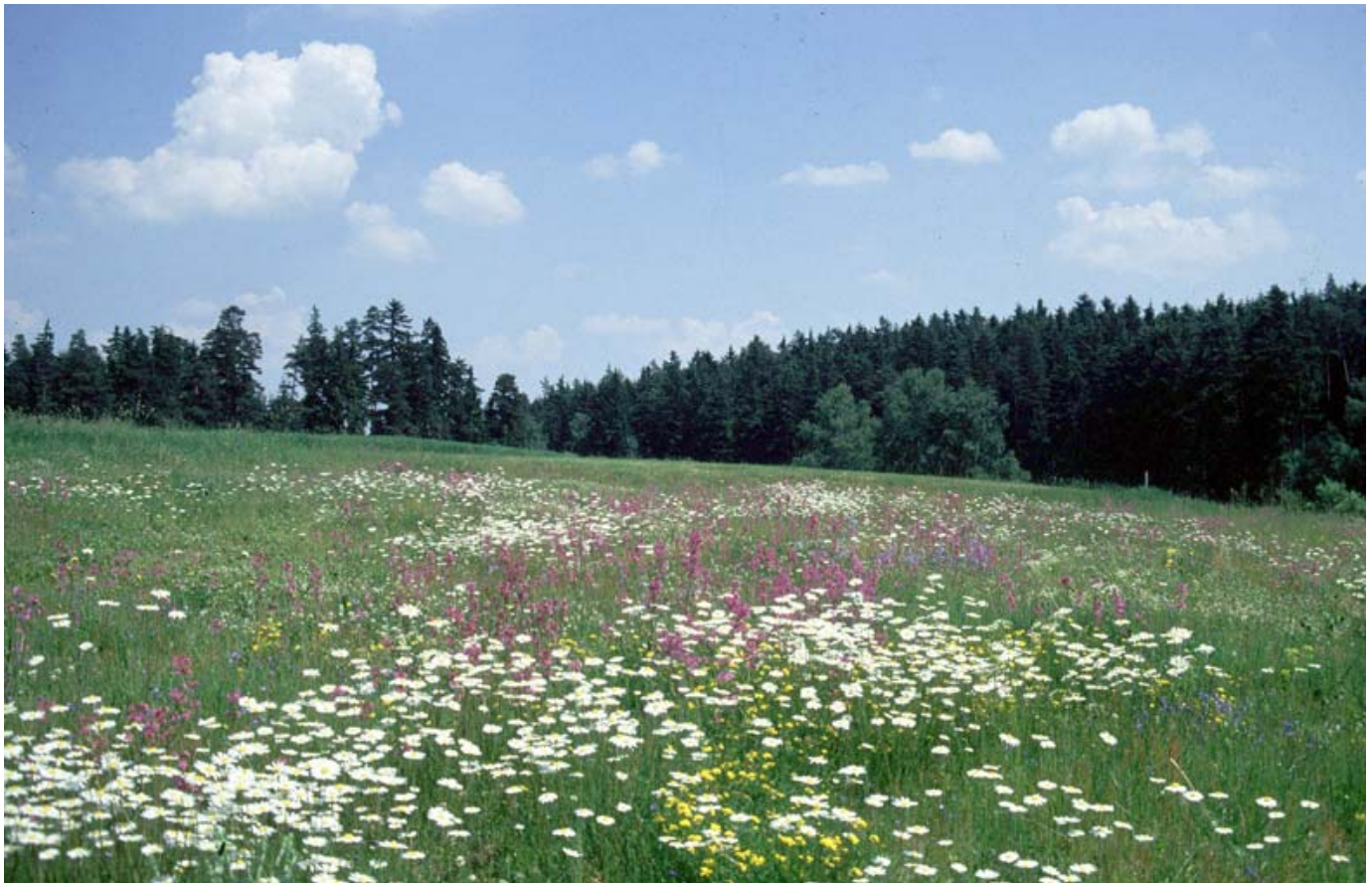
Blütenreiche Wiesen prägen die extensiv genutzte Landschaft des Fichtelgebirges.