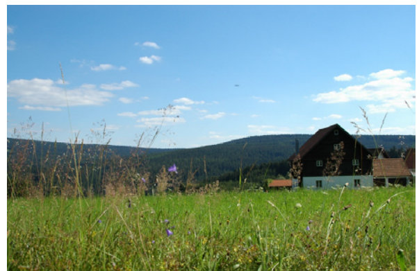
Natur bei Gefrees