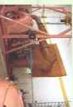
8 Maschinenraum 10 Hammerwerk um 1720

Kinderfrage: In diesem Rahmen findet ihr auf allen Tafeln eine Frage für euch.