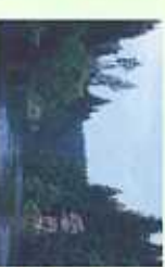
5 Felsen am Egerstaausee