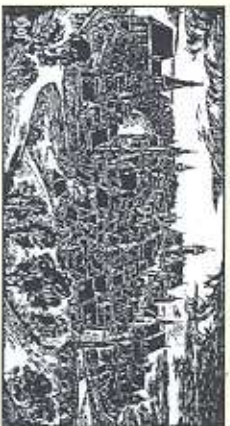
Fachliche Beratung / Texte für Stationen: Privates Jean-Paul-Museum, Leitung: Karin und Eberhard Schmidt

Herausgeber: Verkehrsverein Auenthal e. V., Stadt Hof, die Landkreisgemeinden Köditz, Töpen und Feilitzsch, Landratsamt Hof Layout und Graphik: Landratsamt Hof 7/05